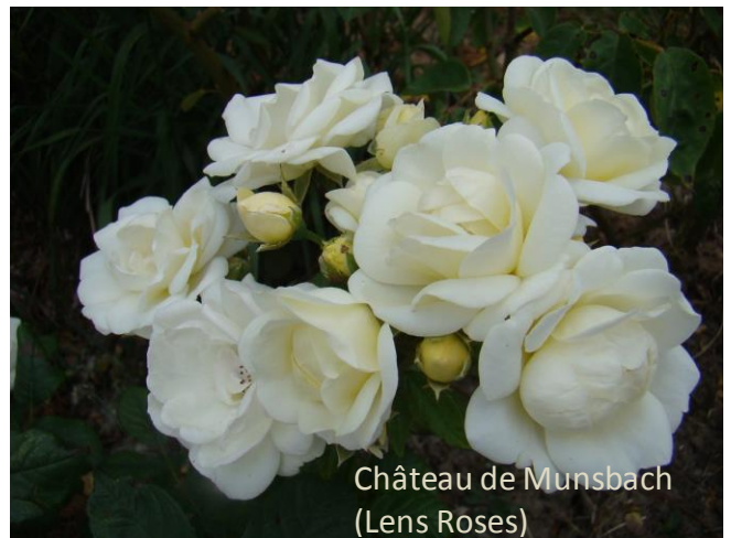
Château de Munsbach (Lens Roses)

De roos is genoemd naar de openbare rozentuin bij het kasteel van Munsbach, aangelegd en onderhouden door de Luxemburgse rozenvereniging waar een collectie rozen met Luxemburgse namen is geplant.