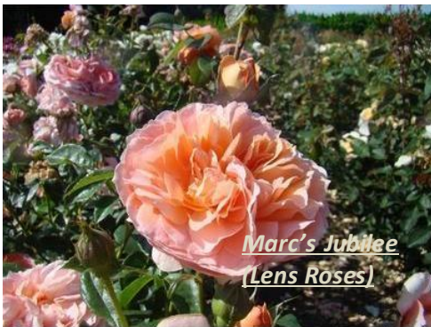
Marc's Jubilee (Lens Roses)